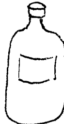
オキシドール (過酸化水素水)