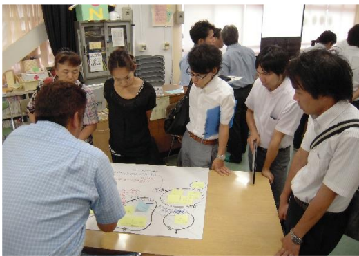
研究協議会の様子

平成25年7月3日、川崎市立小学校情報教育研究会の授業研究会が西有馬小学校でおこなわれました。4年生の子ども達が「考えようわたしたちの生活 見つめようわたしたちの有馬」という単元名を合言葉に、地元・有馬について知りたいことについて、様々な手段で調べるための話し合いをしました。本時では、課題解決の手段を選ぶ「根拠」をグループの中で明確にし、適切な手段を選ぶための支援や活動を盛り込んだ授業デザインに取り組みました。