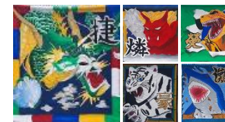
各ブロックのパネル。最優秀賞は緑ブロック(大)。