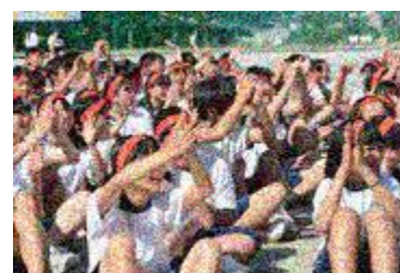
総合優勝に沸き立つ赤ブロック

惜しくも入賞を逃したブロックも1週間の練習をやりきった充実感にあふれていました。