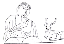
東大寺の大仏と鹿 イラストは生徒作品

す。2日目は、奈良を中心クラスごとに見学して回ります。3日目は、ジャンボタクシーを利用し、