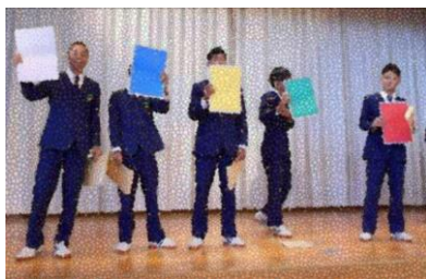
ブロック抽選をする団長たち

1組、1年1組となりました。練習期間中は、団長をはじめとした応援リーダーたちが中心となり、各ブロックの練習に取り組んでいました。女子のダンスは、早朝練習から放課後練習までダンスリーダーが中心となって練習に励んでいました。