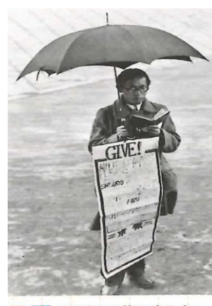
3 駅前で職を探す失業者