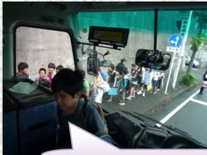
バスに乗り込み、出発！