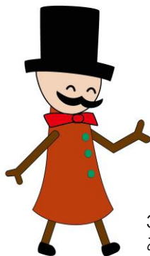
30周年キャラクター みなみすげ男爵

PTA とは、学校、家庭、地域社会での子ども達の健全な成長を願って、保護者と先生が協力しあう【保護者と教職員の会】です。