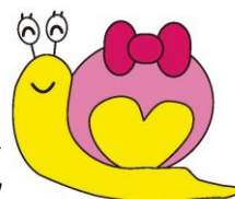
30周年キャラクター ゆっくりん