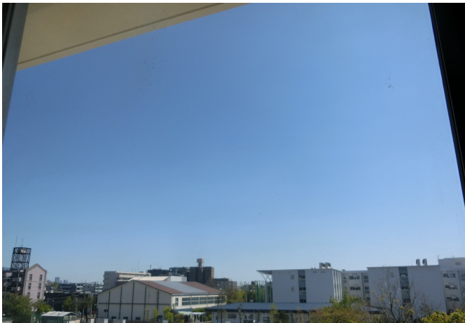
教室からの空のようす（朝）