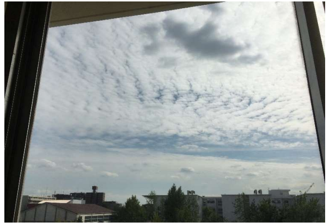
教室からの空のようす（昼すぎ）