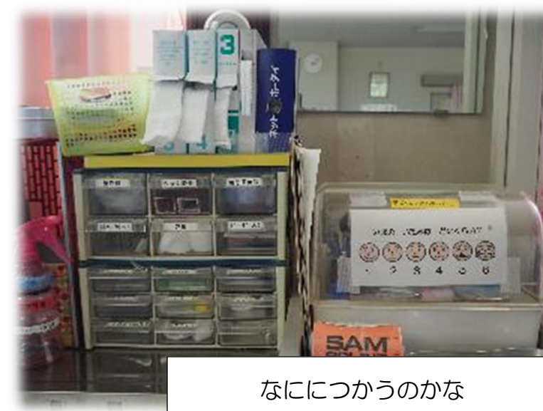
なににつかうのかな