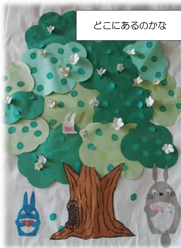
どこにあるのかな