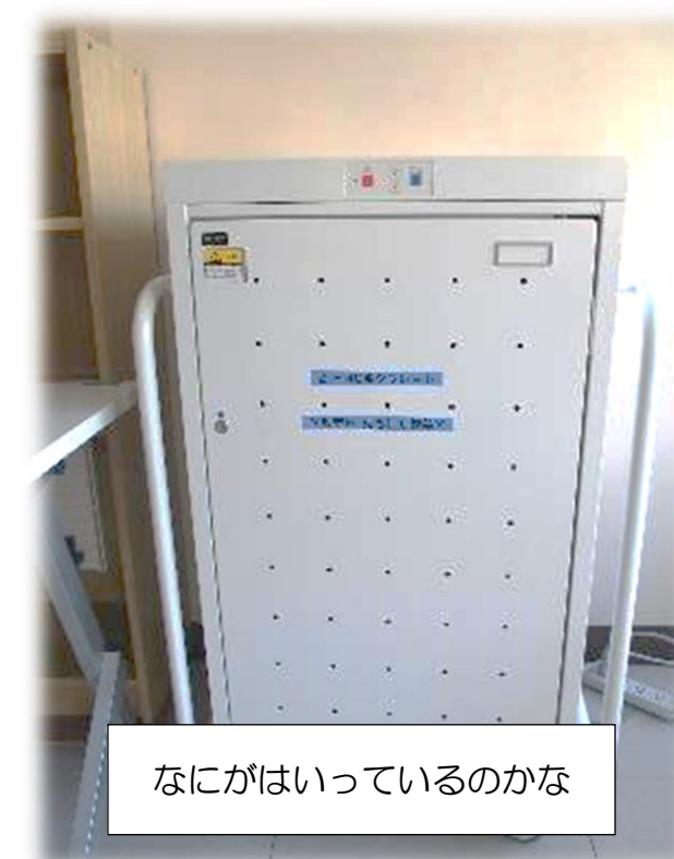
なにがはいつているのかな