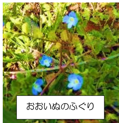
おおいぬのふぐり