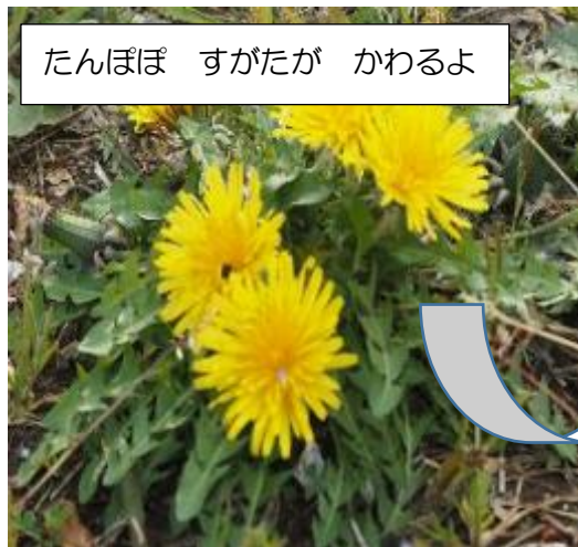
たんぼぼ すがたが かわるよ