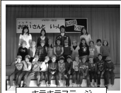
キラキラステージ