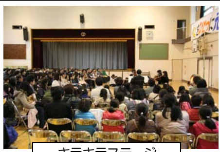
キラキラストーグ

「たくましい心」の育ちとは・・・ ・ねばり強く取り組める ・心身のバランスのよい成長