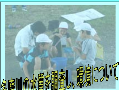
5年 多摩川の水質を調査し、環境について考えよう