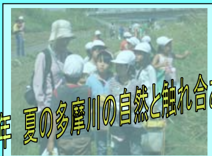
3年 夏の多摩川の自然と触れ合おう