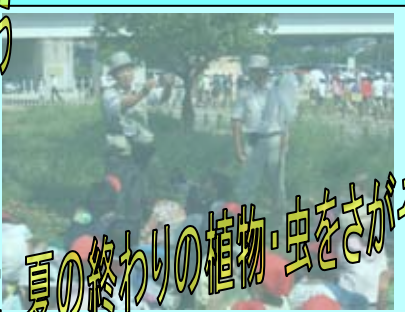
2年 夏の終わりの植物・虫をさがそう